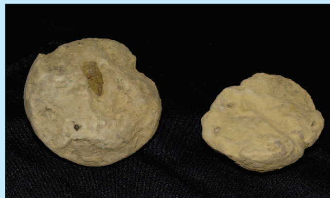
Webgewichte aus einem Grubenhaus

Inh. Angela u. Klaus Landwehr Untere Landwehr 3 38315 Werlaburgdorf Tel. 05335 / 60 51